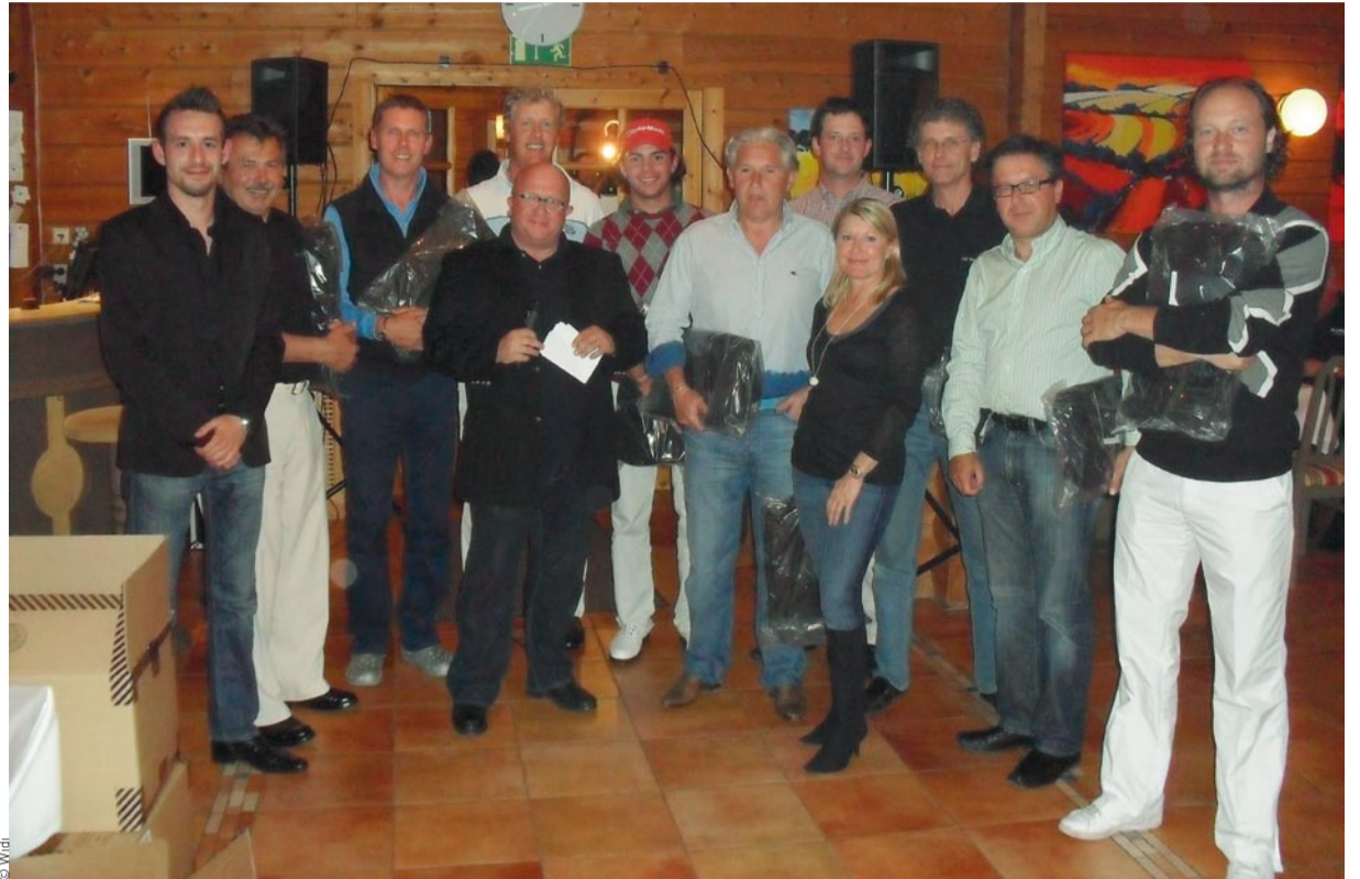
Die Gewinner der ersten Vorrunde freuen sich schon auf das Finale.