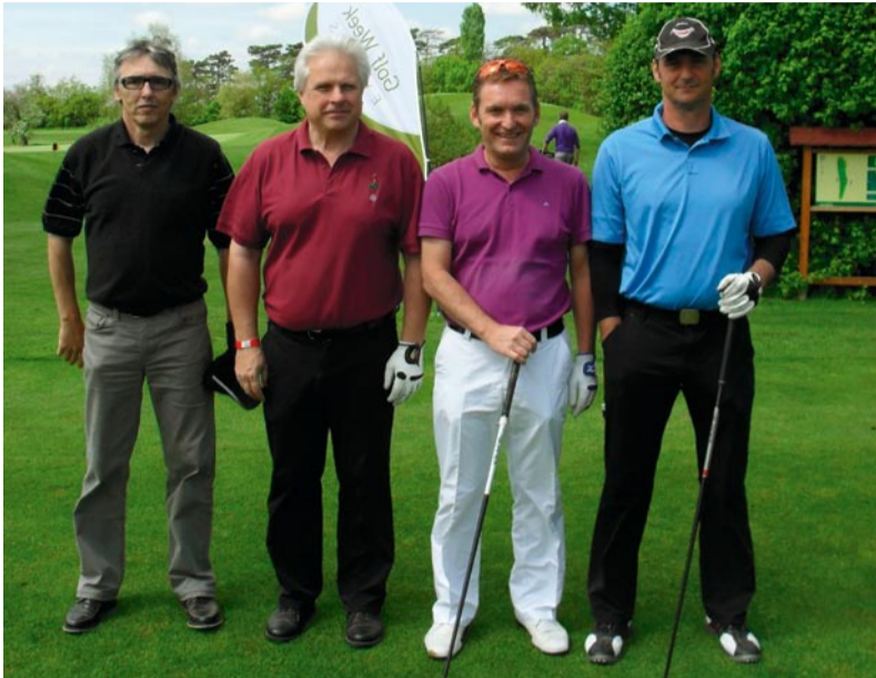
Warten auf den Abschlag.

Die „Golf Week Business Challenge 2010“ startete erfolgreich ins Jahr 2010. Zahlreich pilgerten die Teilnehmer in den Golfclub Schönfeld – Finaltickets gab's aber bekanntermaßen nur für vier Teams.