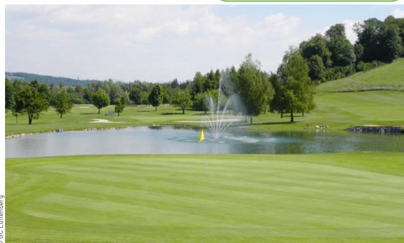
Viele Herausforderungen birgt die Anlage des Linzer Golfclubs Luftenberg.

wundervollen Blick auf die Hügel des Mühlviertels, der schon manchen Golfer auf das Spiel vergessen ließ. Eine ruhig gelegene Terrasse im Innenhof des Schlosses lädt nach der Runde zum Verweilen ein.