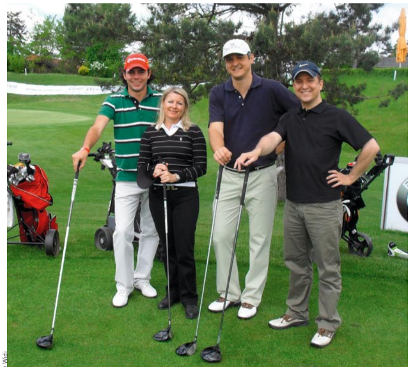
Gute Laune nach einer guten Runde.

Abgerundet wurde der Abend durch ein mehrgängiges Spargelmenü, begleitet von feinsten, von der „Interspar Weinwelt“ gesponserten Weinen und Whisky von Glenmorangie. Letzterer aber nur zum Verkosten, denn guter Whiskey schmeckt einfach immer noch mehr – nach dem Hochland, nach Tradition, nach dem Leben oder nach einer guten Runde Golf!